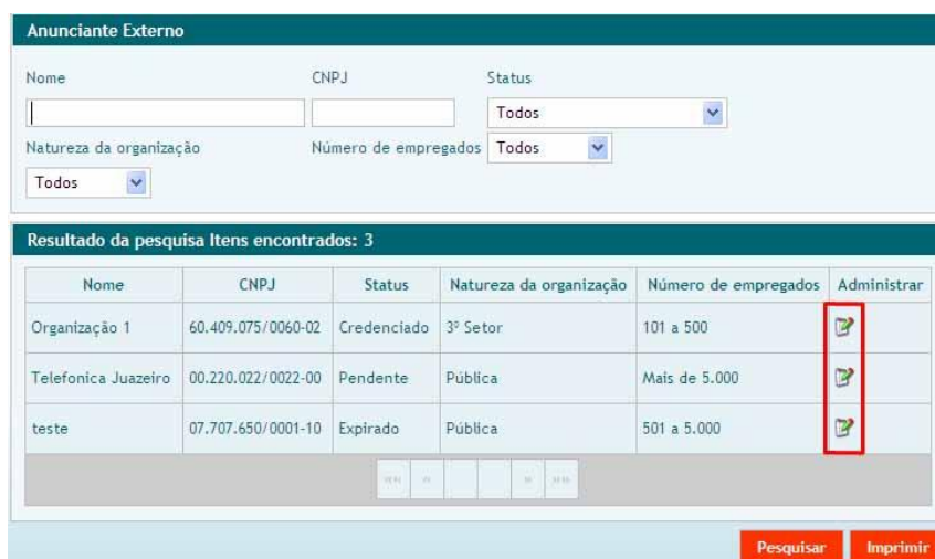
FIGURA 5 - Tela Anunciante Externo

Após realizar uma pesquisa, o usuário receberá, para administrar, uma tela com o resultado concernente a Anunciante Externo (FIG. 5).