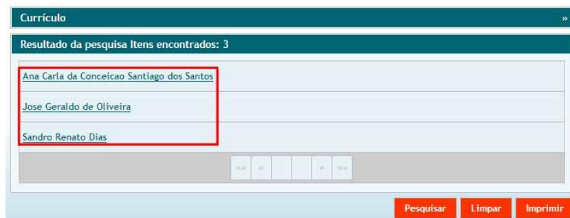
FIGURA 3 - Tela Resultado da pesquisa Itens encontrados

Nessa tela, o usuário poderá acessar os links destacados.